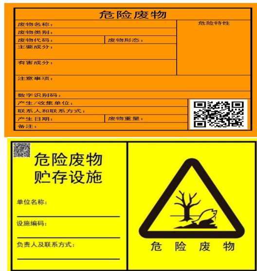
图 4-3 危险废物贮存设施标志及危险废物标签