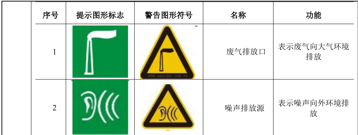
图 4-2 排放口环境保护图形标志